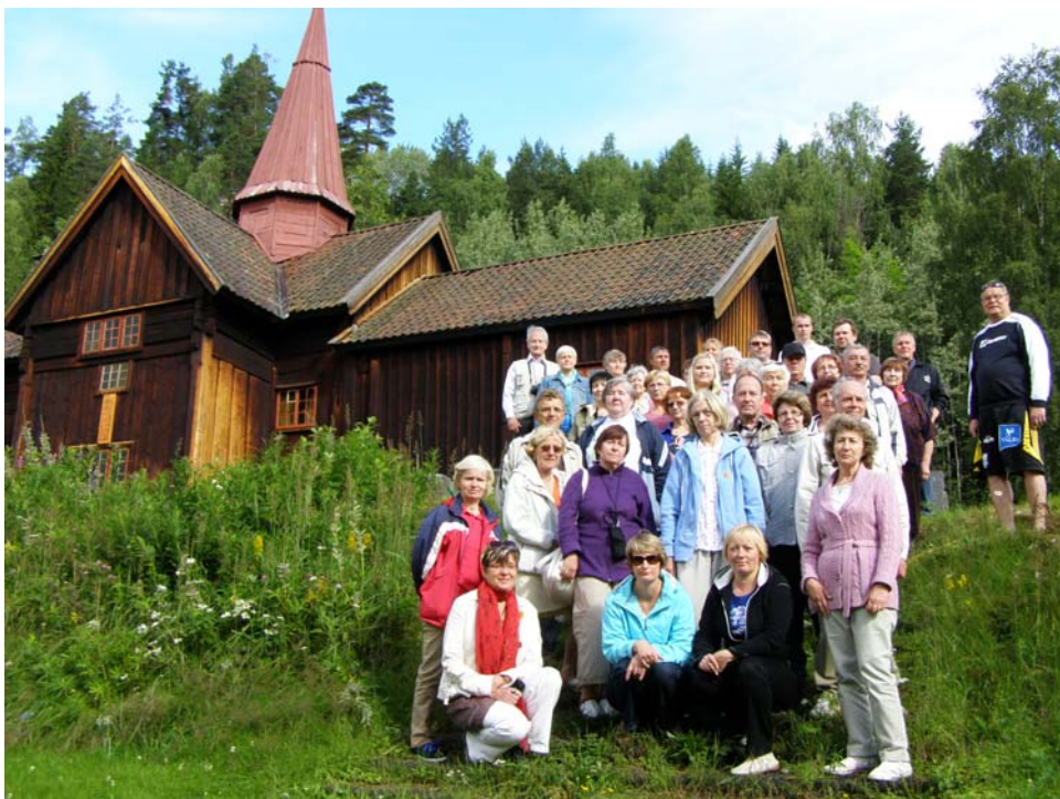
Reisiseltskond Uvdali püstpalkkiriku juures

Norra on täiesti õigustatult uhke oma fjordide üle. Oli kord aeg, mil liustikud taandusid ning vabastasid maapinna. Merevesi on tunginud kaugele sisemaale ning muutnud Norra ranniku narmendava vaiba sarnaseks. Vesi on külm, mäed fjordi ümber on järsud ja kõrged, mõnel pool isegi püstloodis. Süngel veega fjord meenutab pigem mägijärve kui merd. P alju erinevaid laevu sõitis mööda seda majesteetliku veekogu. Kuskil sõitis kindlasti ka mõni väike valge purjekas, mis arglikult oma purjed tõstis ning liugles tasa üle süngel vee, mäenõlvadel saatjaks norra rahvuskultuurist pärit trollide teravad pilgud.