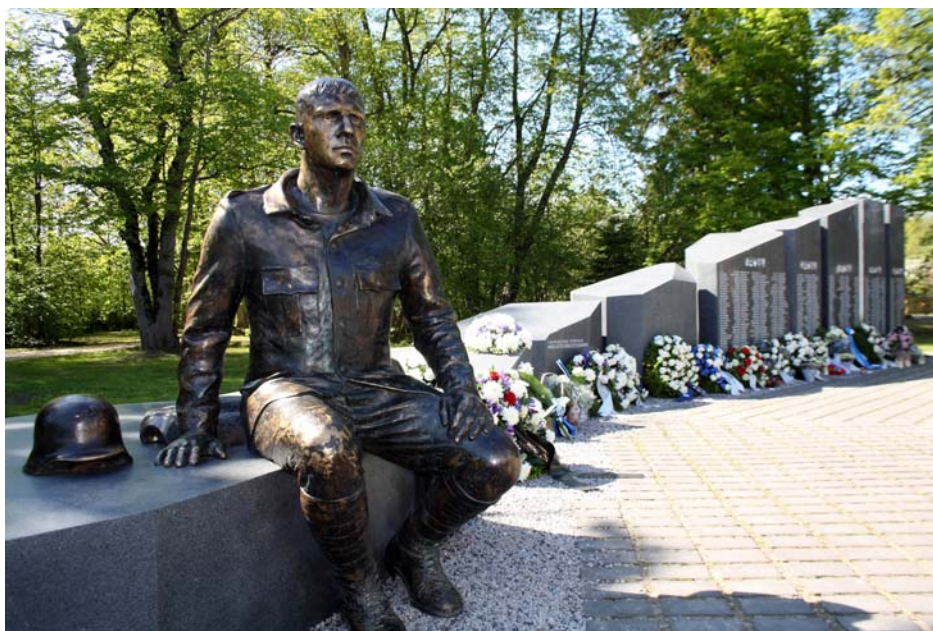
Mälestusmärk Teises maailmasõjas hukkunud hiidlastele.

Mälestusmärgi avatseremoonia viis läbi näitleja Raivo Trass. Koor alustas lauluga „Eesti lipp“. Sellel ajal viidi lipud mälestusmärgi juurde alustesse, kus oli kogu ürituse vältel organiseeritud lipuvalve. Ühiselt lauldi Eesti