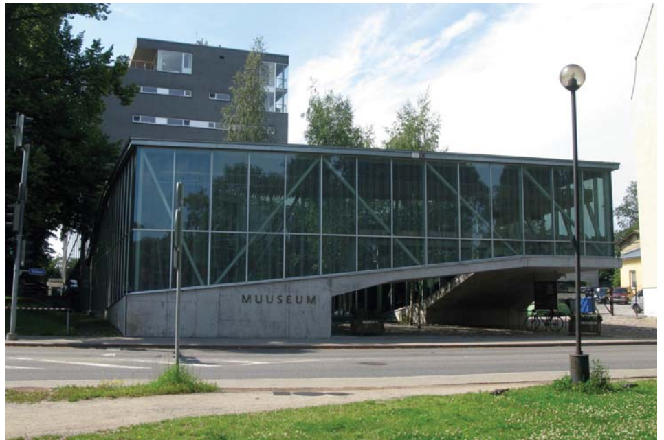
Okupatsioonide Muuseum Tallinnas

sasti okupatsiooniaegsete esemete kogumist, mis on ka tänase kogumistöö suund. Kuigi paljudest nõukogudeaegsetest asjadest on saanud erakogujate huviobjektid, annetatakse jätkuvalt