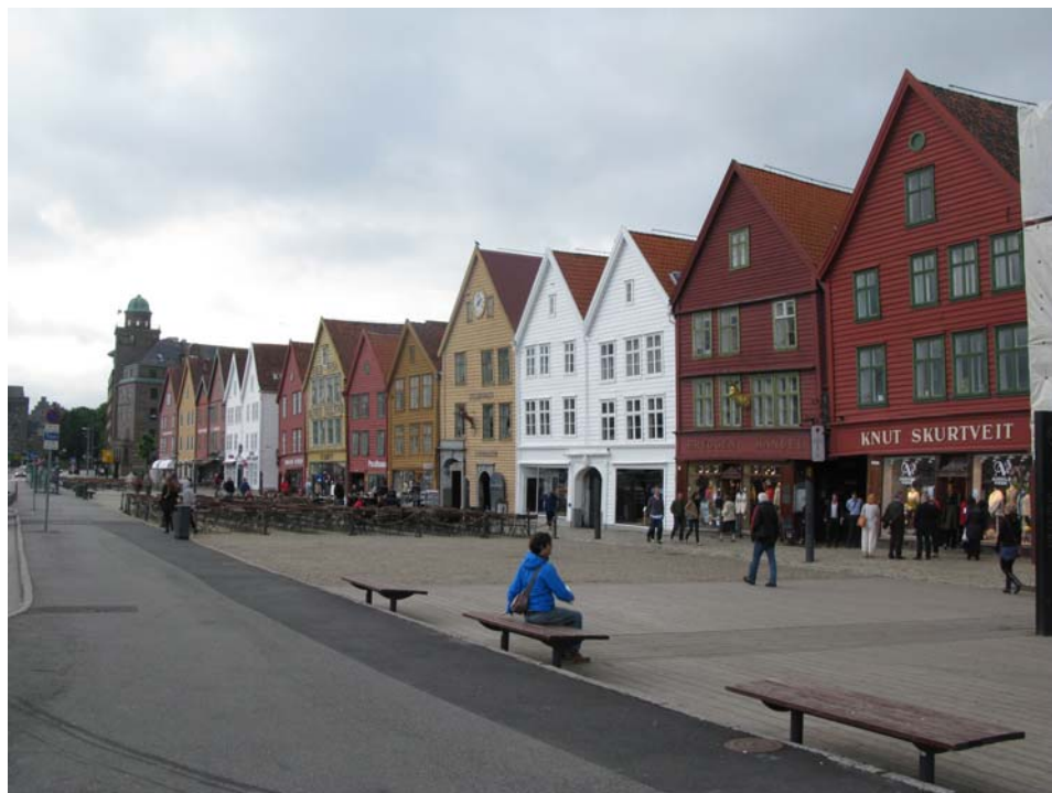
Bryggeni kaipealne Bergenis

läheduses asub uhke kunstimuuseum maailmakuulsate maalidega. Vaid veidi eemal on suur sadam, mis ootab nii uljaid lõbusõitjaid, vaikkeid purjetajaid kui kalureid.