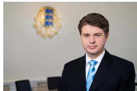
Urmas Reinsalu Kaitseminister

Loodan, et meie ühiskond ei uinu, ega lase end eksitada tühistest argimuredest, neid on alati olnud ja neid tuleb alati veel. Peamine on täita väärikalt oma kohust ning hoida meie riiki ja inimesi, usku paremasse tulevikku. Sest nii on terve Eesti hoitud.